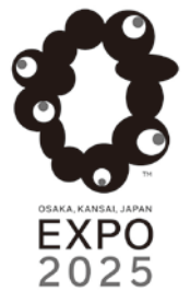
(協力：(公社)2025年日本国際博覧会協会)

2025年大阪・関西万博には東大阪市内企業から85社が出展予定。万博×東大阪モノづくりの魅力を映像にてご紹介するほか、公式キャラクターであるミャクミャクとの写真撮影(予定)などを実施いたします。また、パリ五輪でアスリートを支えた東大阪製品もあわせてご紹介いたします。