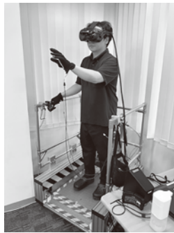
(協力：三徳コーポレーション(株))

製造現場や建築現場など様々なシーンで働く作業員の危険認識・安全管理能力を高めることを目的に、バーチャルリアリティ技術を活用し作業現場で想定される落下・爆発・衝撃など災害シーンをリアル再現。現場での災害を身体で“体感”いただけます。