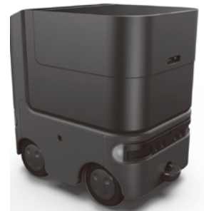
(協力：(株)Hakobot、サンコーインダストリー(株)、近畿大学)

「なんでも載せられる、しっかり運ぶ」をコンセプトに四輪駆動のパワフルな走行と、四輪操舵による小回りの良さを掛け合わせた優れた走破性を実演いたします。