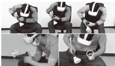
(協力：(株)コベルコ E&M・コベルコ溶接テクノ(株))

バーチャル上に熟練溶接士の動きを再現し、その運棒法をまねることで、時間や場所を問わず、溶接の早期習得を促進します。10段階の電流調整機能で、より実際の溶接に近いトレーニングを体験いただけます。